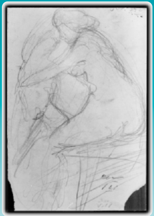
Título: Figura de mujer sentada Técnica: Lápiz sobre papel Medidas: 23,5 x 17,5 cm N° Inventario: 278-27d Notas autor: Dib. 2970 Est. 3 Comp. 161 V 18

dadaísmo y el surrealismo, no pudieron quedar exentos de su creación plástica, tenía que manifestarse en él una nueva concepción de lo plástico y lo estético. Definida la temática, el cambio se produjo en la formalidad de la técnica.