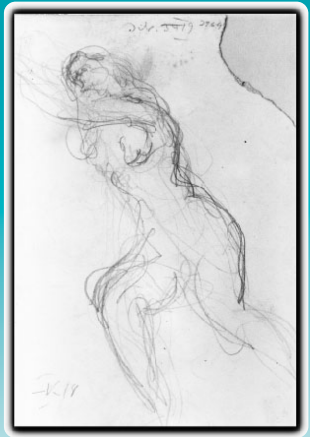
Título: Figura de mujer en movimiento Técnica: Lápiz sobre papel Medidas: 23,5 x 17,5 cm N° Inventario: 278-27c Notas autor: Dib. 2969 V 18