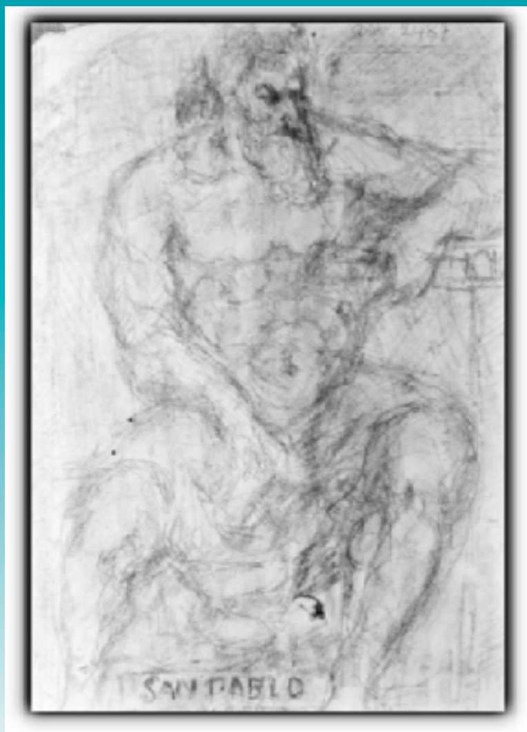
Título: San Pablo Técnica: Sanguina sobre papel Medidas: 28,5 x 22,5 cm N° Inventario: 277-7 Notas autor: Dib. 2487 VIII 17 Dib. de Mens 806