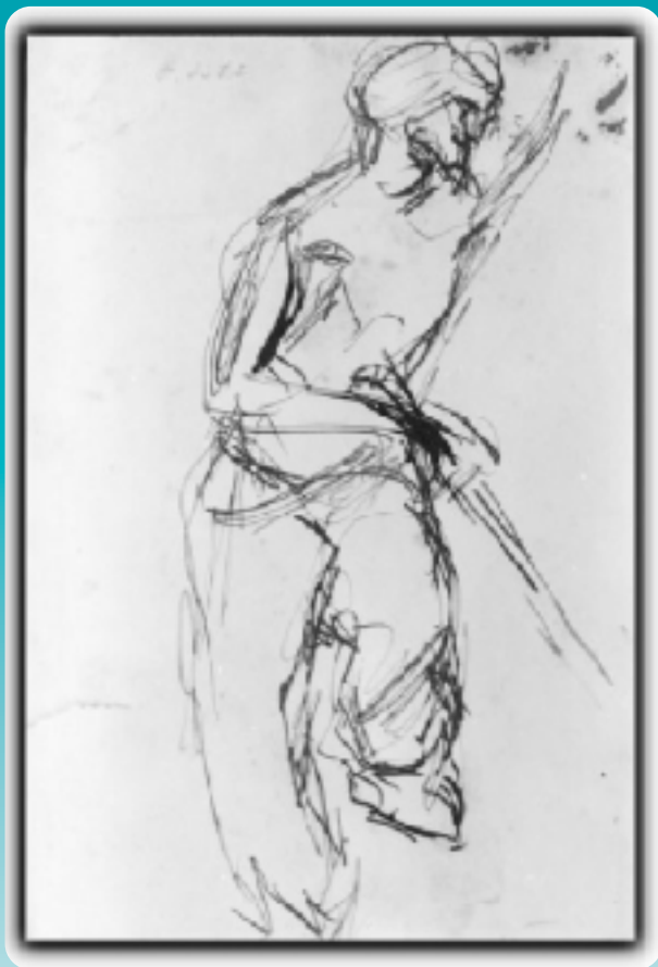
Título: Croquis figura mujer Técnica: Tinta sobre papel Medidas: 14 x 21 cm N° Inventario: 280-8 Notas autor: Dib. 4082 VIII – 19 Croq. mujer 1624