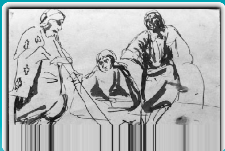
Título: Bosquejo 3 figuras escena mapuche Técnica : Tinta sobre papel Medidas: 20,5 x 12,7 cm N° Inventario: 280-9 Notas autor: s/n

Sus dibujos fueron evaluados por Richón Brunet y Oscar Lucares, quienes lo aceptaron de inmediato como alumno regular. Como también era aficionado a la música se sintió exhortado a matricularse en el Conservatorio Nacional, donde recibió clases de piano y órgano.