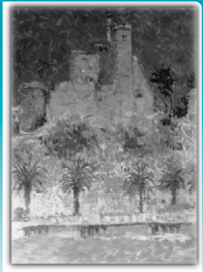
Título: Paisaje Castillo Yarur Técnica: Óleo sobre tela Medidas: 73,5 x 54,5 cm N° Inventario: 267-53

Recientemente, el nombre de Pedro Luna surge al realizarse dos actividades como homenaje póstumo al que fuera considerado un pintor moderno , en su forma de concebir y expresar la pintura. En abril de 1997, la Corporación Cultural de Las Condes, organiza una exposición retrospectiva, con más de cien obras de distintas colecciones particulares, y en 1998 la Pinacoteca de la Universidad de Concepción, una muestra de 37 pinturas (parte de su colección) en Los Angeles, junto con el traslado de sus restos desde Viña del Mar al Cementerio General de la misma ciudad en donde nació. Este gesto constituye una ofrenda para aquel solitario gigante de la plástica nacional.