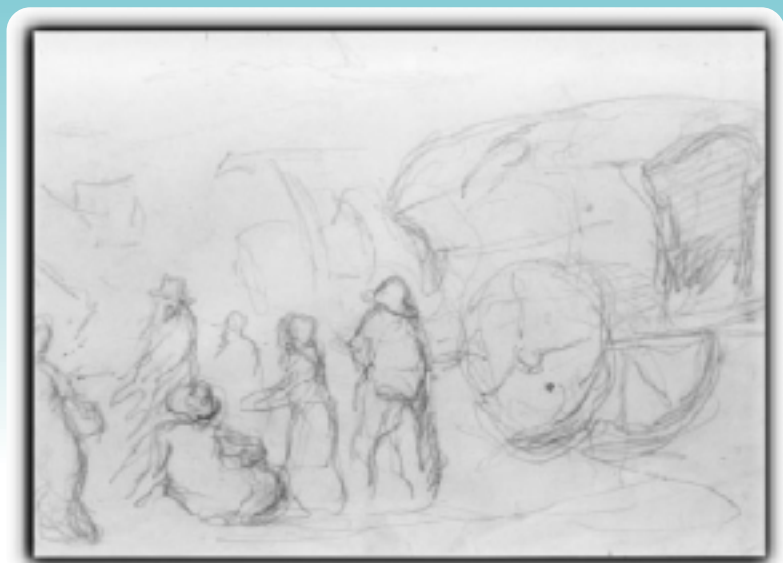
Título: Figuras junto a una carreta Técnica: Lápiz sobre papel Medidas: 25 x 34 cm N° Inventario: 278-36 Notas autor: Dib. 3060 XII – 18 Croq. Figs. 1274