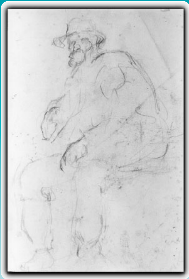
Título: Figura de hombre Técnica: Lápiz sobre papel Medidas: 31,5 x 24 cm N° Inventario: 278-19 Notas autor: Dib. 530 Croq. de Figs. 264 PlzlaReclta