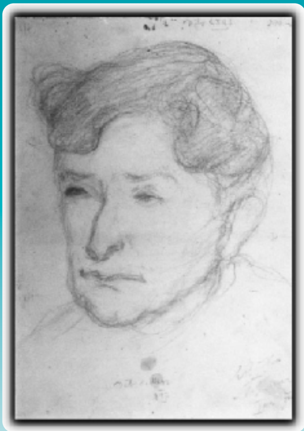
Título: Estudio de cabeza Técnica : Sanguina sobre papel Medidas: 23 x 29,5 cm N° Inventario: 277-6 Notas autor: Dib.2323 est. Figs.Humanas VIII 17 Dib. Figs. 817